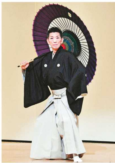
長唄 助六 坂東寛太=福井