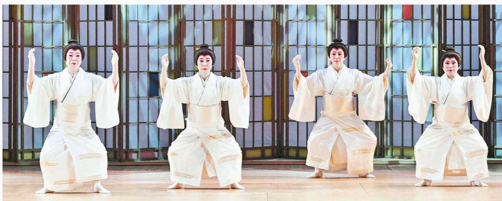
①テクノロジーの発達

北陸三県の日本舞踊家が流派を超えて集う中日名扇会の第二十一回公演(中日名扇会、北陸中日新聞、日刊県民福井主催)が二十七日、金沢市の石川県立音楽堂邦楽ホールで開かれた。若手、中堅の踊り手が長唄九番で華やかな舞を披露し、特別企画の創作舞踊「平成から未来へ」では、会の中核を担う六人が、平成の出来事や新時代への希望を日本舞踊で表現した。